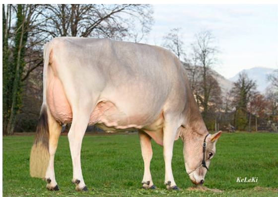
FLD-KLE GENETICS ARROW ADELL DAM