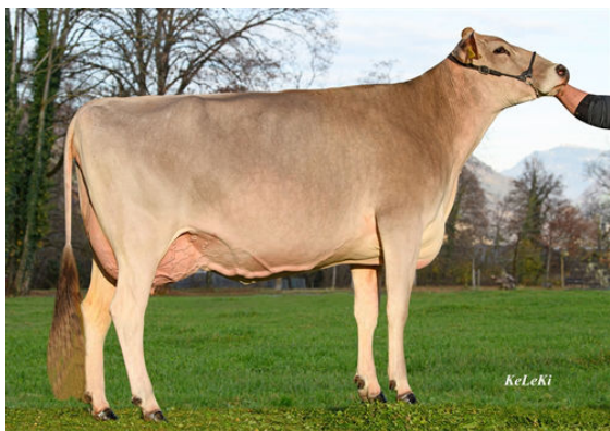
FLD-KLE GENETICS ARROW ADELL DAM